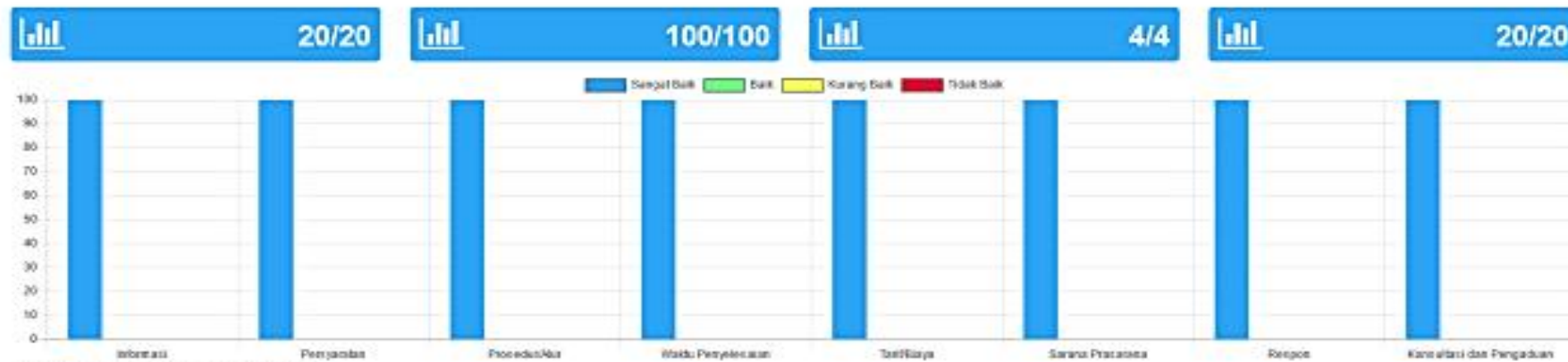
99 I. KUALITAS PELAYANAN (IKM)