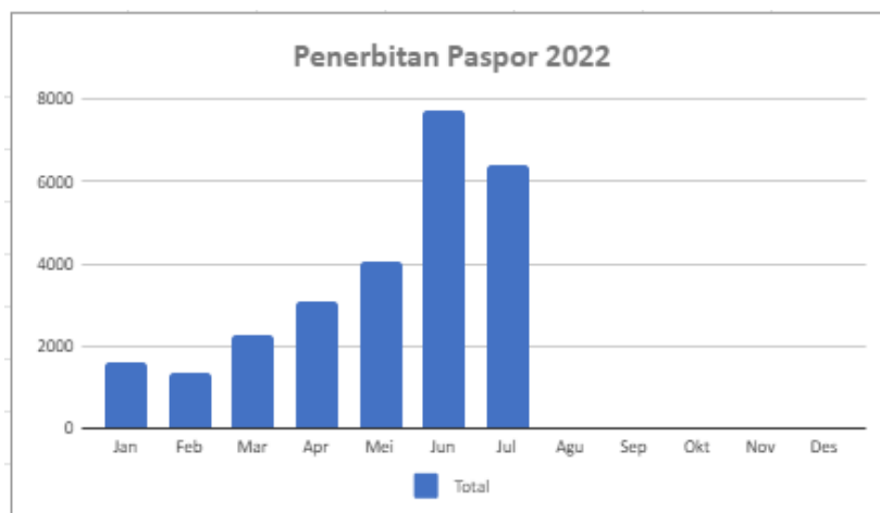
Grafik penerbitan paspor Kantor Imigrasi Kelas I Non TPI Depok